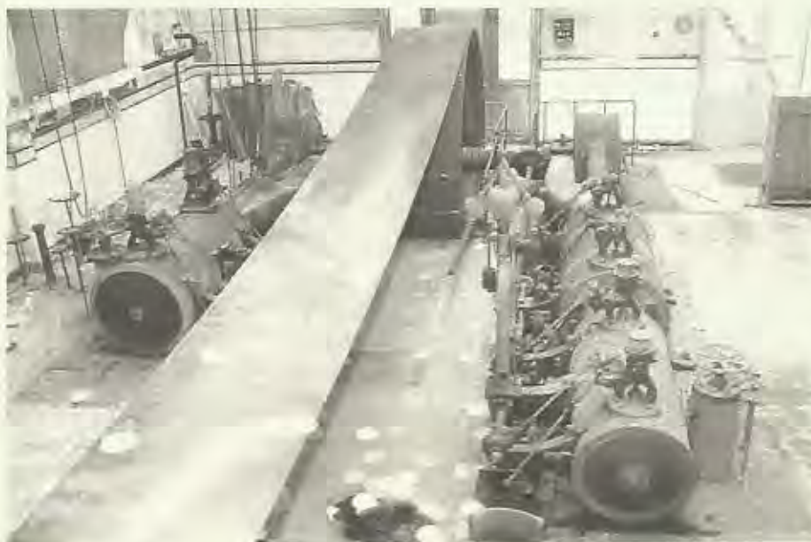
De cross-compound drievlinderstoommachine in het wat betere tijden