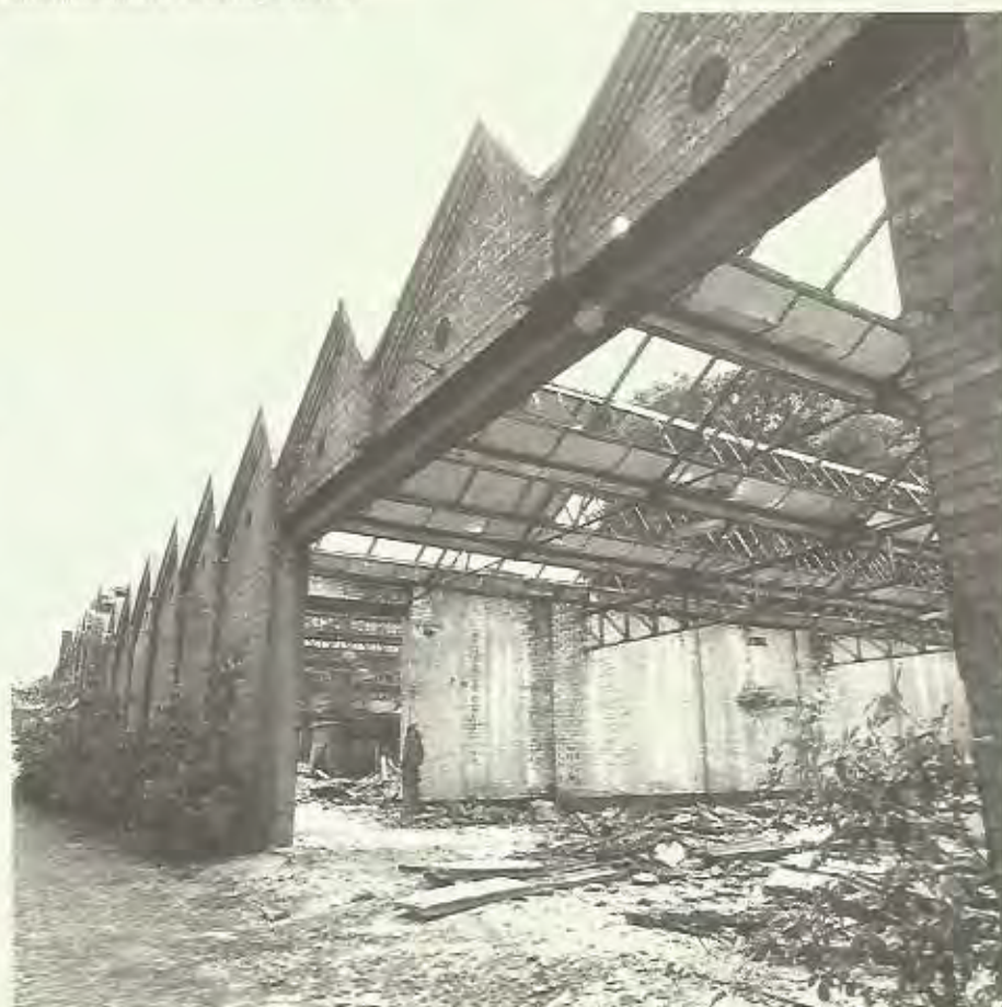
De vroegere fabrieksgebouwen van 'Filature et tissage Emile Destoop', vóór de renovatie.