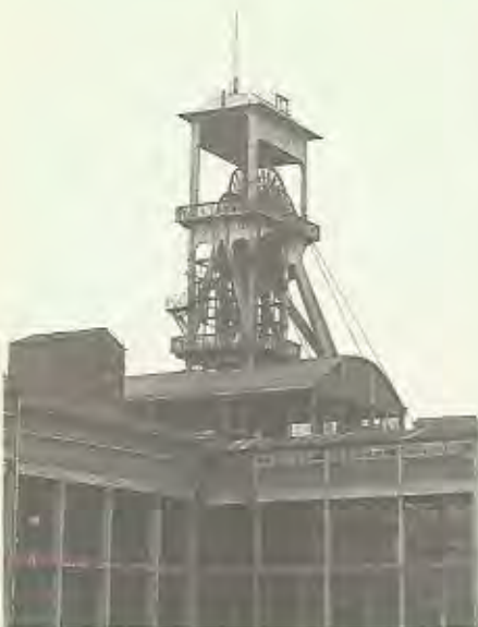
Eisden: de bediende betonnen schachtbok

Van de beloofde beschermingen is intussen weinig merkbaar en wij vrezen dat ook de beloofde museumprojecten in de gekende diepvriezers terecht kwamen.