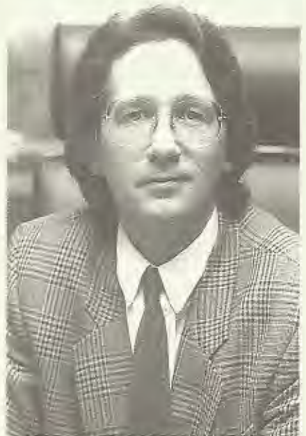
Erik Derycke (Waregem, 28.10.49) is licentiaat in de rechten en werd begin 1990 Staatssecretaris van Wetenschapsbeleid. Hij is daarnaast onder andere ook lid van de Interministeriële Conferentie Wetenschapsbeleid en van het ministerieel comité voor Wetenschapsbeleid en Onderwijs. Het Staatssecretariaat voor Wetenschapsbeleid is gevestigd op de Galilleilaan 5, 10de verd., 1030 Brussel

Ik ben ervan overtuigd dat de VVIA in deze discussie de weg zal blijven wijzen.