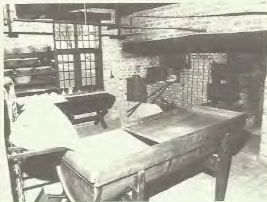
Oud bakkerijtje anno 1909

De VVIA zal trouwens één van volgende maanden een exclusief avondbezoek aan het museum organiseren.