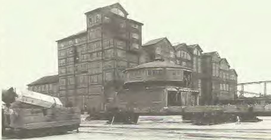
Winterslag: de tot sloping veroordeelde kolenwasserij