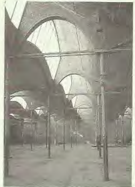
Terrasa: textielabriek Aimerit y Amat

Door onze collega's van de 'Asociación Española del Patrimonio Industrial' werden vijf industriële sites bij UNESCO voorgedragen voor erkenning als 'Erfgoed van de Mensheid'. Het betreft de Suikerfabriek Motril in Granada (waarin niet minder dan negen stoommachines en een volledige produktieinstallatie voor rietsuiker bewaard bleven), de glasfabriek van San Ildefonso de La Granja in Segovia (opgericht door Filips XVIII in de 18de eeuw en één van de oudste fabrieksgebouwen van Europa, thans herbruikt), de zweefbrug 'Puente Colgante de Portugalete' in Bilbao, de textielabriek Aimerit y Amat in Terrasa (dit wordt het centrale punt voor het 'Museu de la Ciència y de la Tècnica' van Catalonië) en de reeds overbekende Colonia Güel.